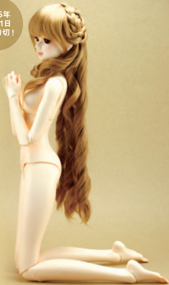
※写真はAtriさんが組立て、彩色をした作品例です。 商品は未組立て、未彩色でのお届けとなります(ハンドパーツは別売り)